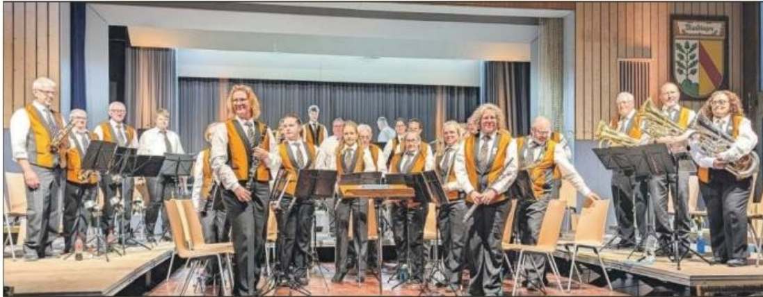
Die MGR auf der «Neumattenhalle»-Bühne